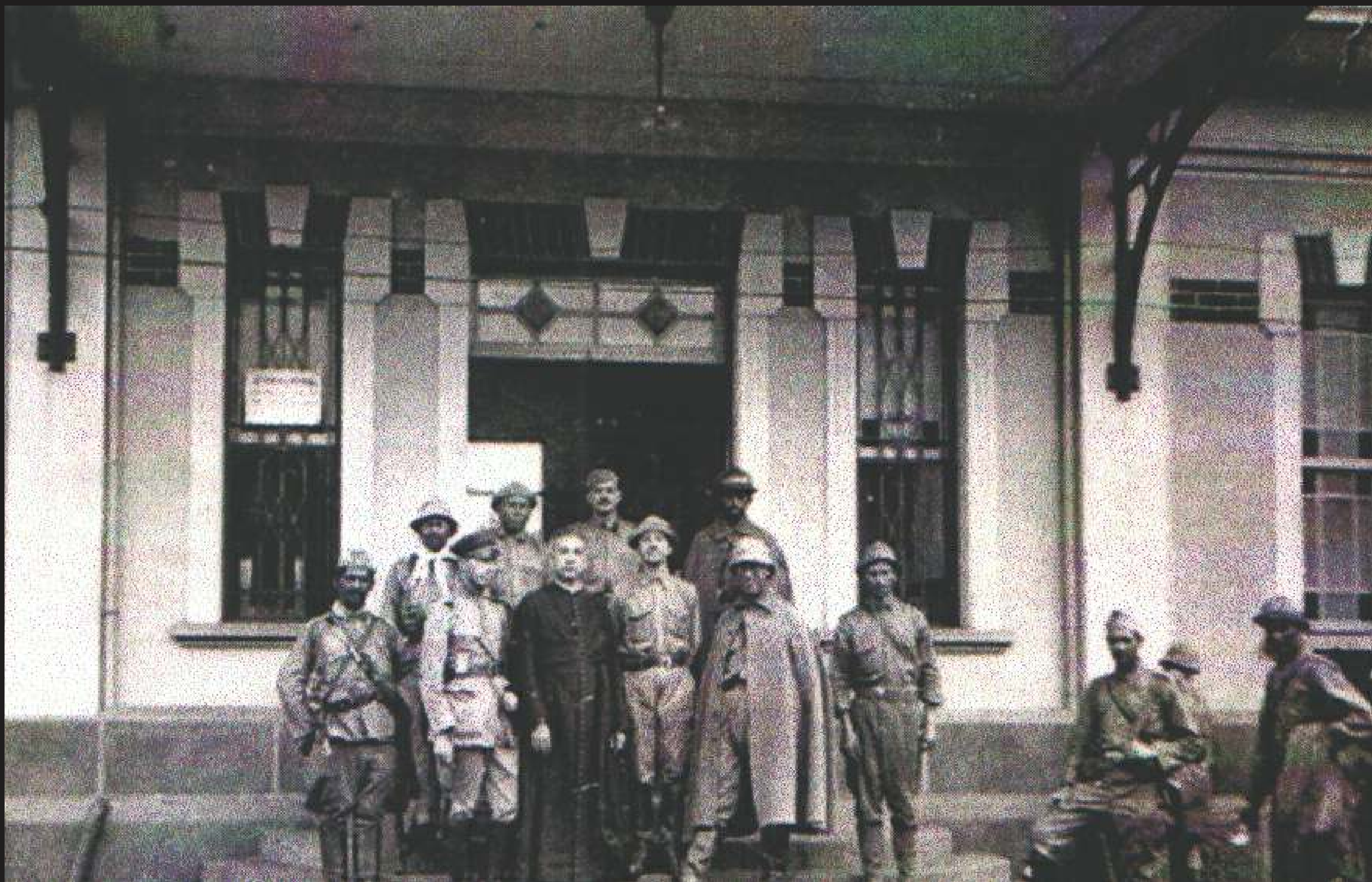
A Estação de Trem da Paulista foi o ponto de partida dos voluntários de Piracicaba em 1932