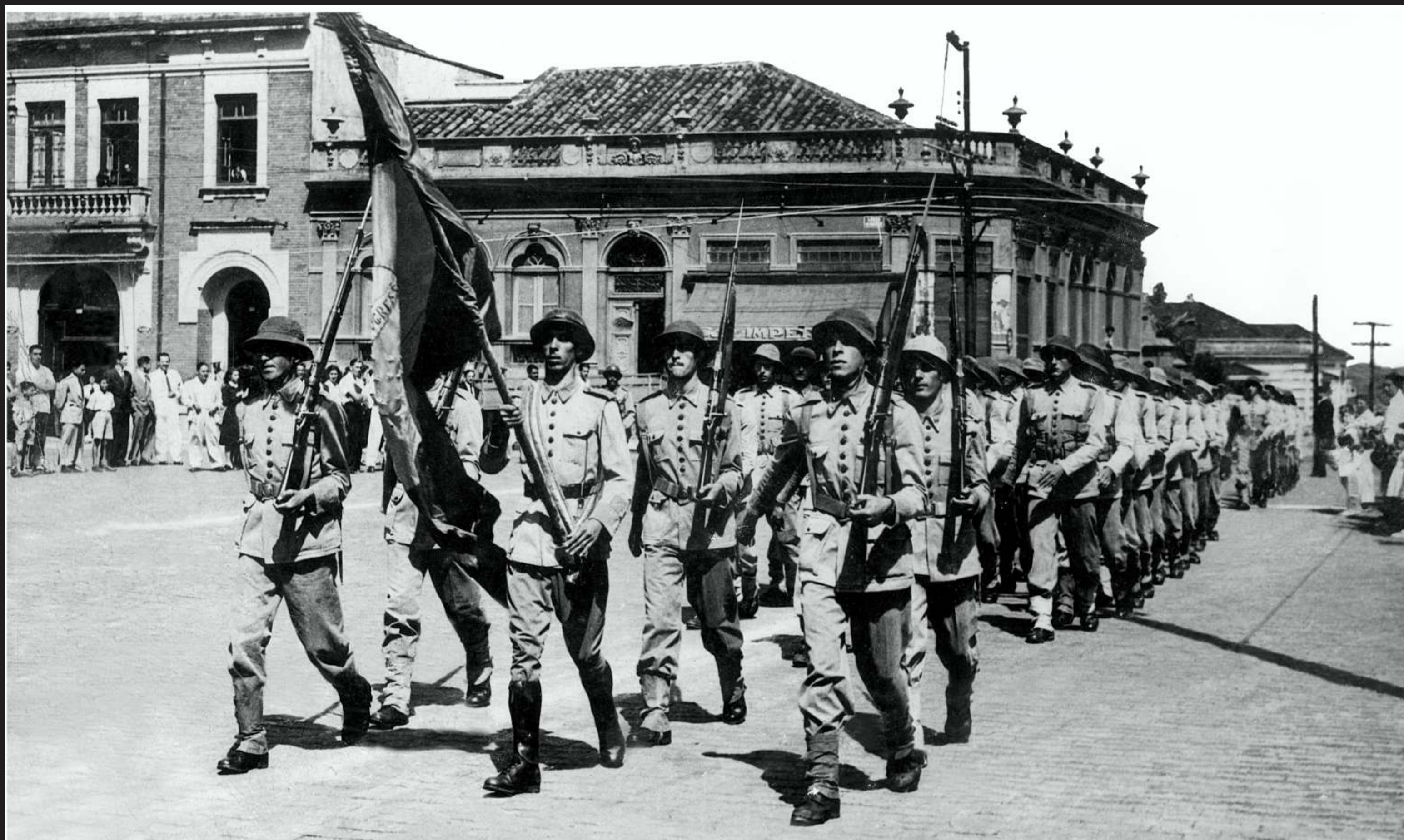
O Tiro de Guerra de Piracicaba foi uma força atuante na Revolução de 1932 garantindo a segurança em espaços públicos de grande concentração