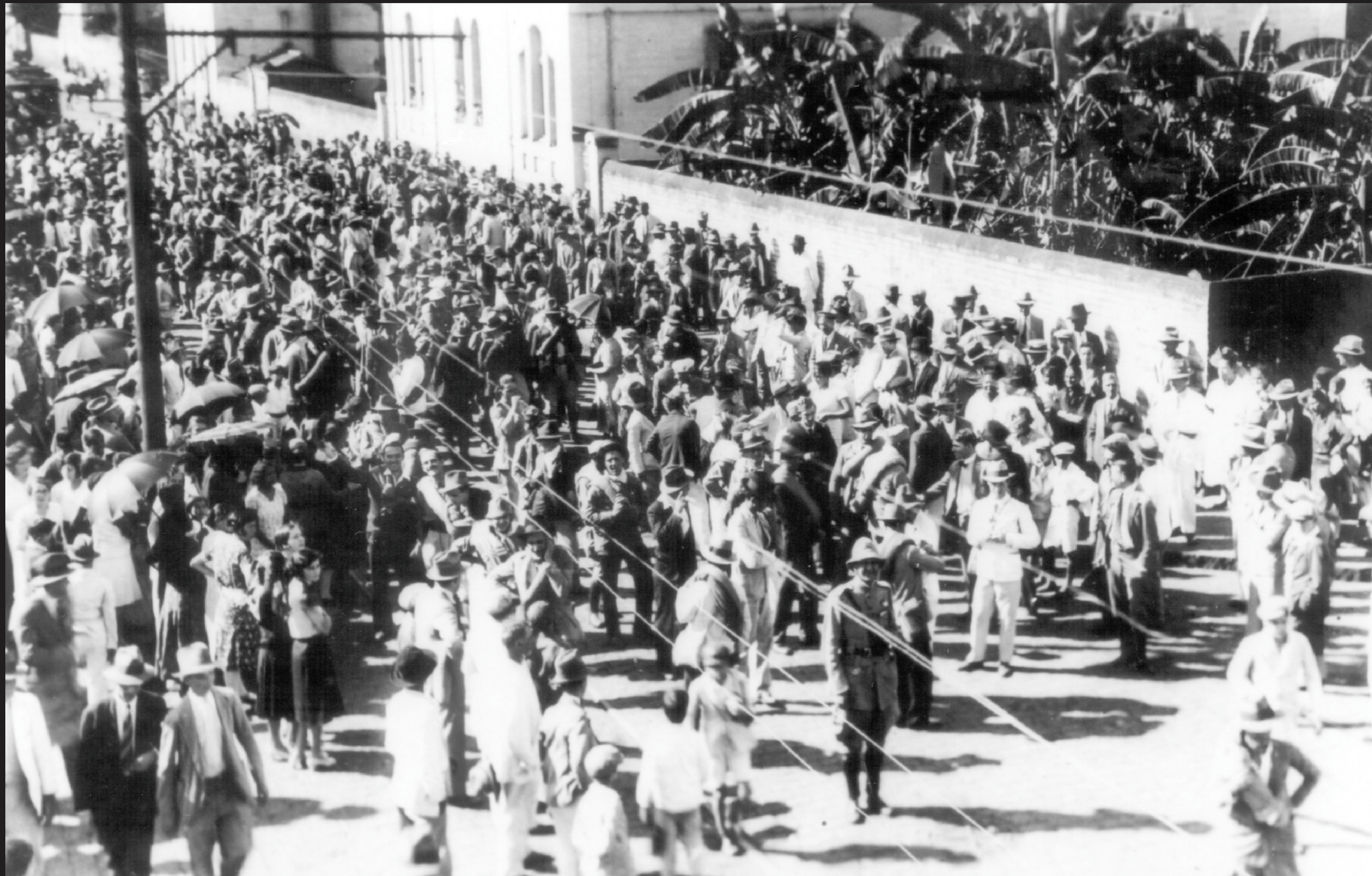
O Batalhão Piracicabano parte para São Paulo onde iria para o fronte de batalha, em 16 de julho de 1932. Foto na rua Boa Morte, Centro de Piracicaba.